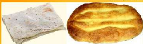
Национальные виды хлеба