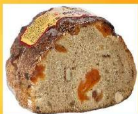
Улучшенные сорта пшеничного хлеба