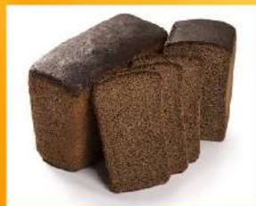
Хлеб ржаной простой