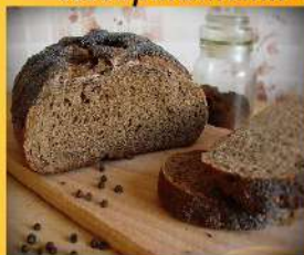
Хлеб ржаной улучшенный