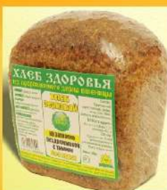
Диетические хлебобулочные изделия