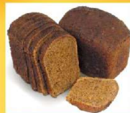
Хлеб ржано-пшеничный улучшенный