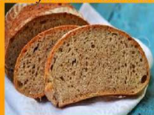
Хлеб ржано-пшеничный простой