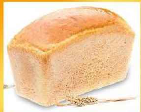
Простой пшеничный хлеб