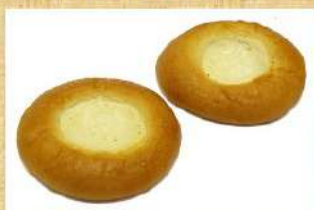
Сдоба с начинкой