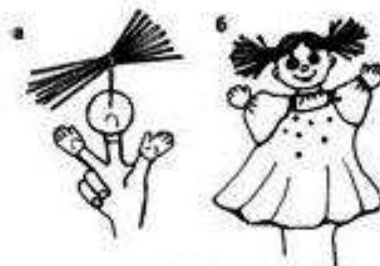
Рис. 30. Пальчиковая кукла

Скатать соленое тесто, вылепить шарик-заготовку головы. Чтобы голову куклы надевать на указательный палец, необходимо в заготовке сделать углубление на фалангу пальца. Из ниток сделать волосы, закрепить их с помощью проволоки, и свободный конец проволоки спрятать в заготовке (рис. 30, а).