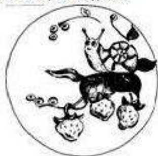
«Улитка» на подставке

3. Отдельно вылепить элементы композиции: клубнички, улитку, листья. Или в виде объемной композиции на подставке