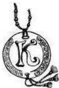
Рис. 56. Кулон-именной

Очень оригинально кулон будет смотреться, если в него вдеть кожаный или плетеный по технологии макраме шнурок (рис. 57).