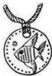
Рис. 57. Кулон «Знак зодиака»