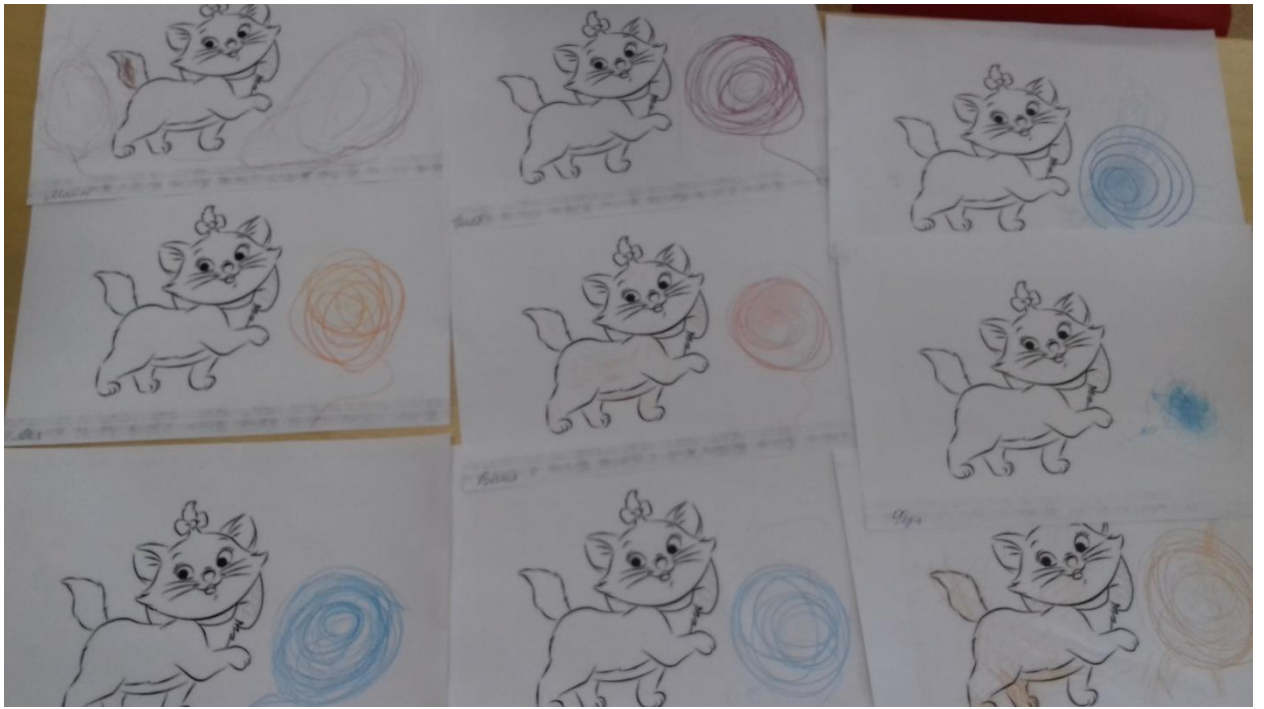
Котёнок благодарит детей.