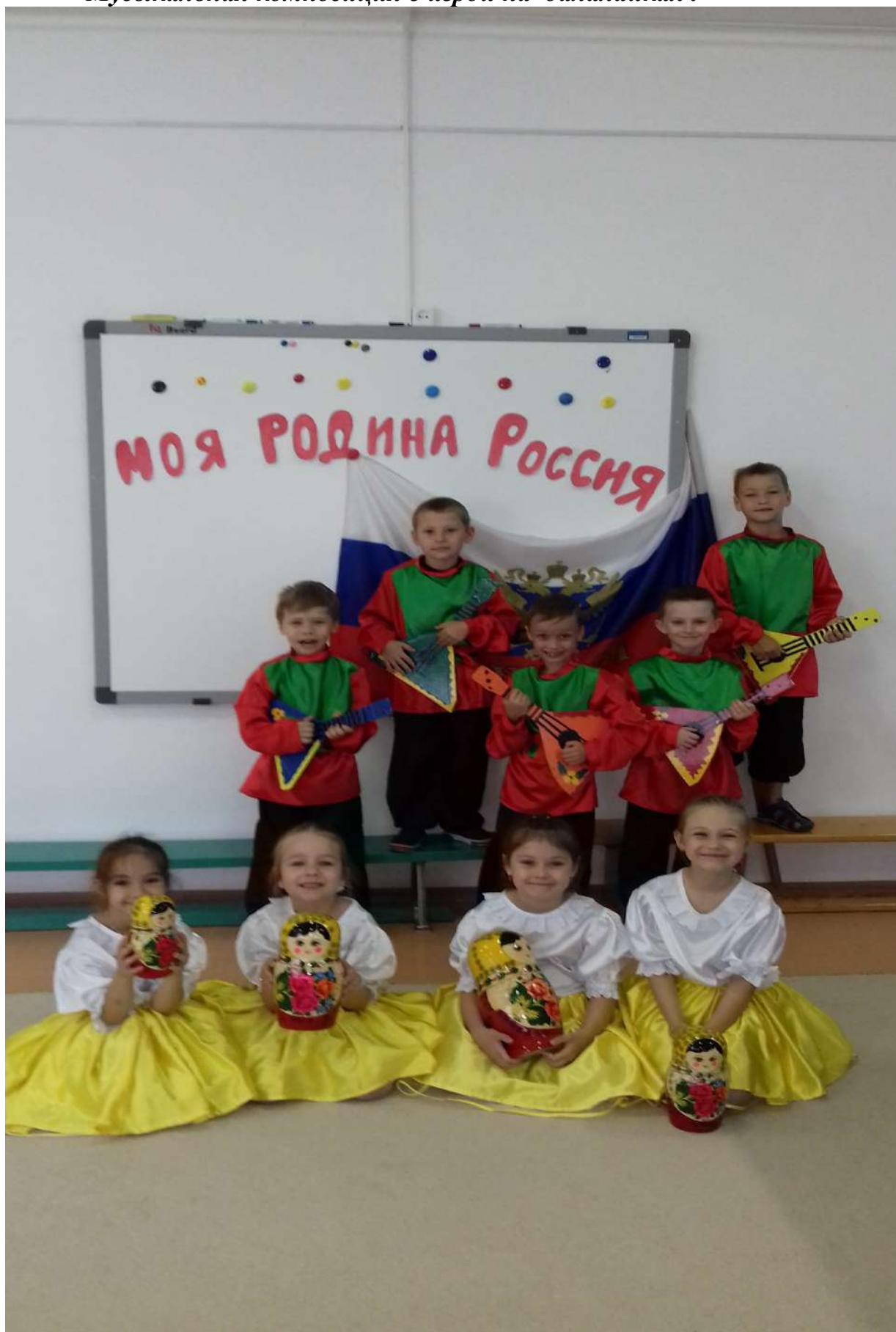
Музыкальная композиция с игрой на балалайках.