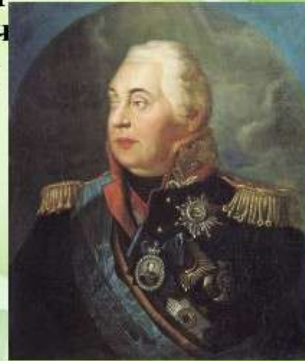
Михаил Илларионович Кутузов

Ведущая. А народ русский действительно великий. Велик он своими умельцами, путешественниками, спортсменами, учеными - всех не перечислить! Богата наша Родина талантами. Сколько замечательных людей прославляли Россию своим творчеством и трудом! Вспомните и назовите знаменитых писателей, поэтов и композиторов: