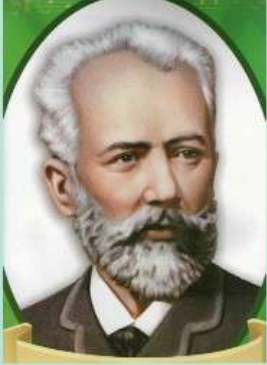
Пётр Ильич Чайковский